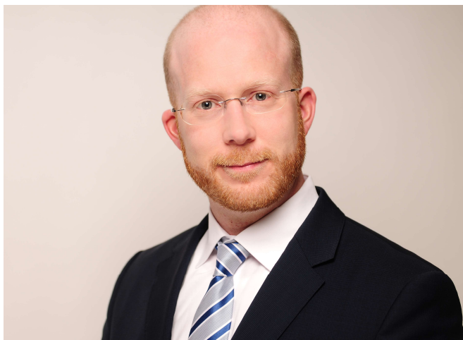
Foto: Uli Schunk, Marketing Manager bei MTI Technology GmbH