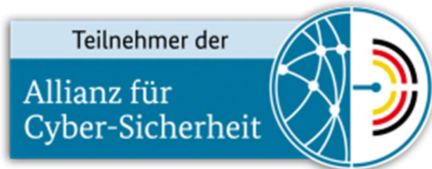
Grafik 2: Logo für Teilnehmer der Allianz für Cyber-Sicherheit [ACS]